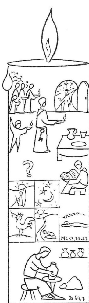
1º Domingo Paz

Neste sentido, desafiamos os casais com filhos pequenos a ler o Evangelho e colorir em família o caminho da luz.