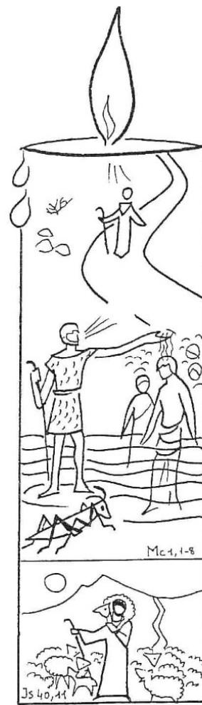
2º Domingo Esperança