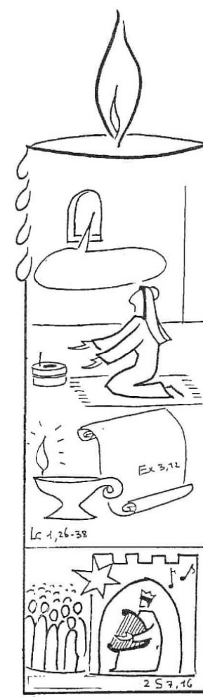
4º Domingo Alegria