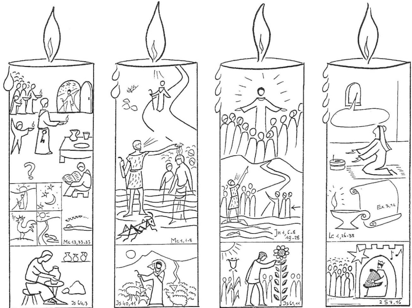
1º Domingo Paz

Neste sentido, desafiamos os casais com filhos pequenos a ler o Evangelho e colorir em família o caminho da luz.