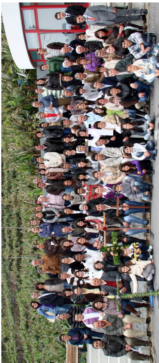
Via Sacra na Tabua ENS Sector Oeste (17 Abril 2011)

Sector Oeste ens.madeira.oeste@gmail.com