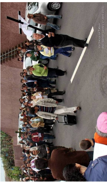
Via Sacra na Tabua ENS Sector Oeste (17 Abril 2011)